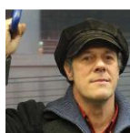
Emmanuel Fleitz Musique, installation sonore France